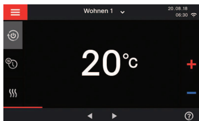
Ecran couleur 7 pouces tactiles