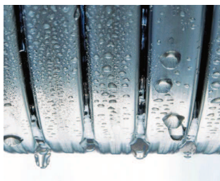
Echangeur de chaleur Inox-Radial

La surveillance automatique de la qualité de combustion compense les qualités variables de gaz (compatible gaz vert). Ceci assure une efficacité élevée et stable.