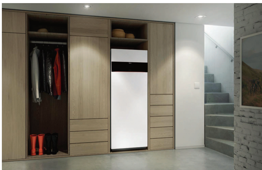
Vitodens 222-F au design élégant couleur Vitopearlwhite

La Vitodens 222-F combine intelligemment l'efficacité de la technique de condensation gaz et un confort eau chaude élevé – elle est facile à utiliser, possède une grande longévité.