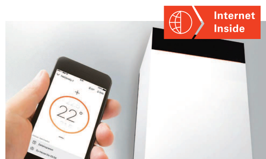
Régulation aisée par ViCare App