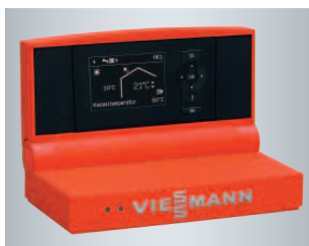
Régulation Vitotronic avec menu déroulant clairement structuré